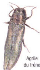
Agrile du frêne

Entrée en vigueur le 2 janvier 2004 des nouvelles exigences canadiennes à l'importation pour les matériaux d'emballage en bois.