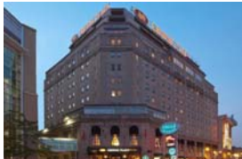
Crowne Plaza Fallsview

Vous pouvez réserver une chambre Fallsview room au tarif préférentiel de: